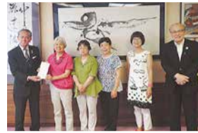
OMUSUBIプロジェクト美郷様 (中央4名)