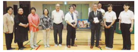
千葉県ママさんバレーボール連盟様(右2名) 子ども食堂代表の皆様(左5名)