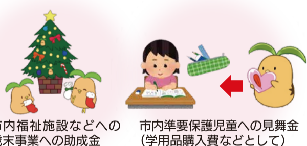
市内福祉施設などへの歳末事業への助成金

共同募金運動の一環として、毎年12月に実施されるものです。区・自治会・町内会にご協力をいただきながら、市内民間福祉施設への支援をはじめ地域福祉活動の推進・強化に役立てられています。皆様からの募金は、100%成田市で活用されます。