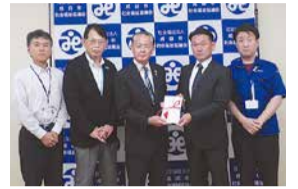
TDK労働組合東日本本部成田支部様 TDK株式会社成田総務部様 (右2名)