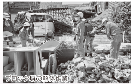
ブロック塀の解体作業