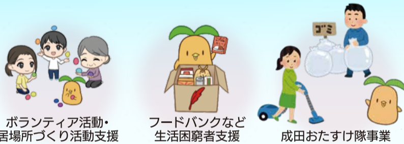
ボランティア活動・居場所づくり活動支援