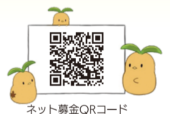
ネット募金QRコード

ネットからのご寄付も受け付けております。クレジットカードやコンビニ支払い、キャリア決済などさまざまな決済方法をご用意しています。