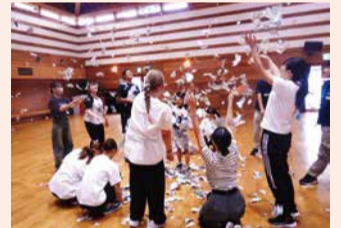
新聞紙を細かくちぎって紙吹雪を作って放り投げました

この事業は障がいを持った子どもたちが、学生ボランティアなどと一緒にレクリエーションや運動を行うことで夏休みの思い出作りや、保護者の一時的なリフレッシュなどを目的に開催しました。