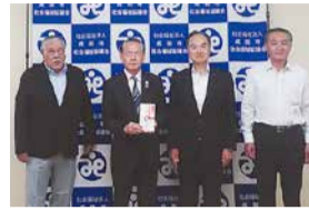
成田法人会様 (左1名、右2名)