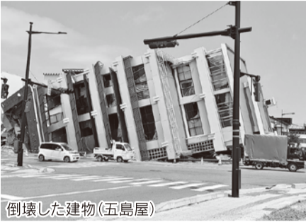
倒壊した建物(五島屋)

輪島市ではまだ受け入れできる宿泊施設がないため、七尾市の和倉温泉を拠点に、毎日、輪島市まで片道1時間半ほど掛けて通います。金沢市から七尾市までの道中はそれほど大きな被害を受けた家屋などは見られず、