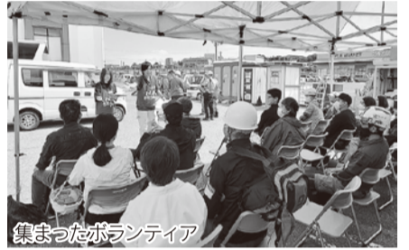
集まったボランティア

普段、土建業などに従事している方々ですので、機械を操作して手際よく片付けや高所作業などを行っています。しかし、機械を入れられないような狭い場所で、傷つけたり壊したりしないような配慮を必要とする手作業が主な活動については、大勢のボランティアの手が必要となります。