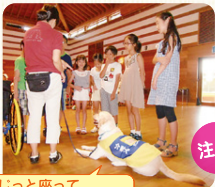
じっと座って指示を待つチャロ君

また、講座を通して介助犬についての正しい知識を持つ人が増え、介助犬と利用者の安心にもつながっていくことでしょう。