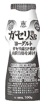
【脂肪ゼロ・砂糖不使用】 ドリンクタイプ100g