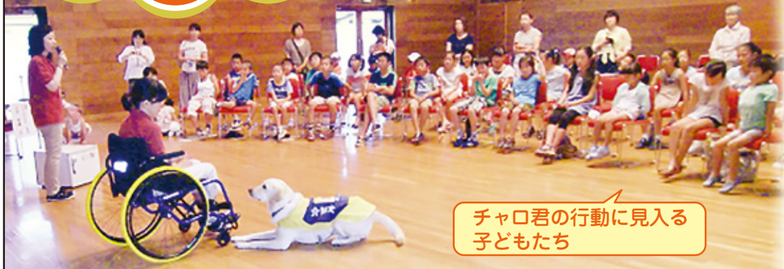
チャロ君の行動に見入る子どもたち