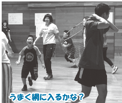
うまく網に入るかな？

8月1日、今年で3回目となる「ふれあいサロン」が開催されました。今年7名の小中学生が参加し、千葉県障害者スポーツ・レクリエーション協会の講師の指導のもと、スポンジボールや柔らかいディスクを使ったゲームなどを行いました。