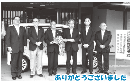
▲右から成田遊技場組合様、千葉県ヤクルト販売(株)様、千葉県遊技業協同組合様

千葉県遊技業協同組合、千葉県ヤクルト販売株式会社、成田遊技場組合、の3団体から福祉車両の寄贈がありました。いただいた福祉車両は、操作ボタンひとつで座席シートが移動し、体の不自由な高齢者や障がい者にとって楽に乗車ができます。