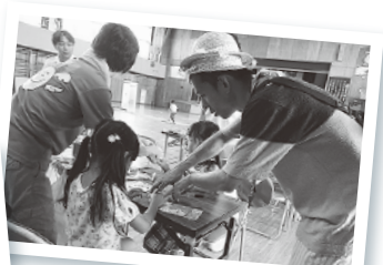
お子さんの帽子をかぶってお父さんも奮闘中!?