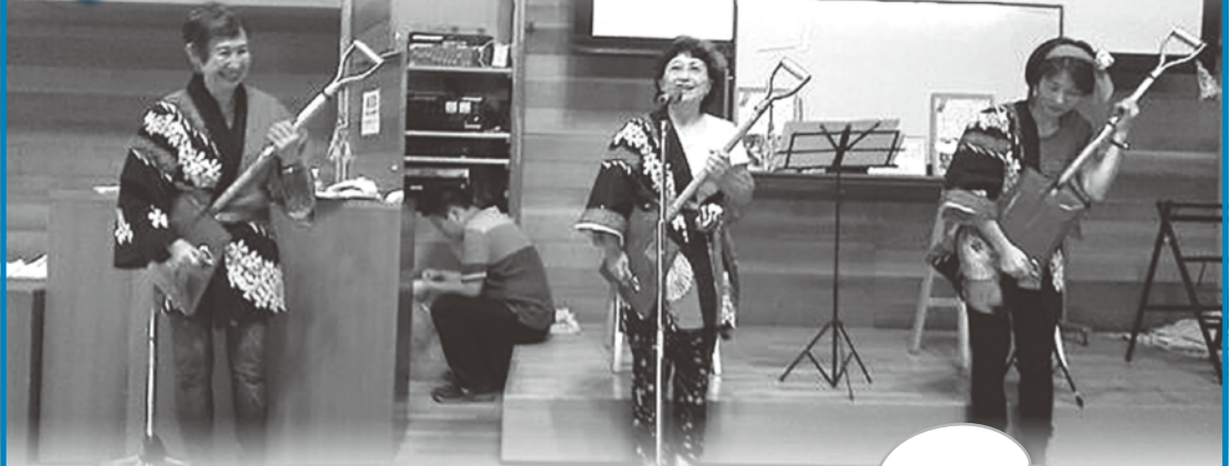
▲グループ名「めぐっこ」によるスコップ三味線