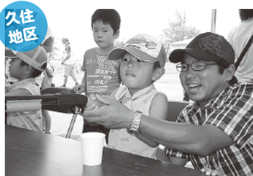
▲「狙いをさだめて…」お父さんと一緒に射的をしたよ！