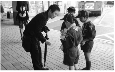
▲募金の呼びかけに足を止めて協力くださる皆さん