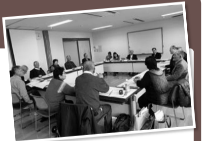
▲地域での工夫や情報を交換し、次の活動へつなげます

3月4日に4地区(中郷・遠山・加良部・昭栄)の地区社協が集まり、地域で直面している問題や解決の方法などを話し合いました