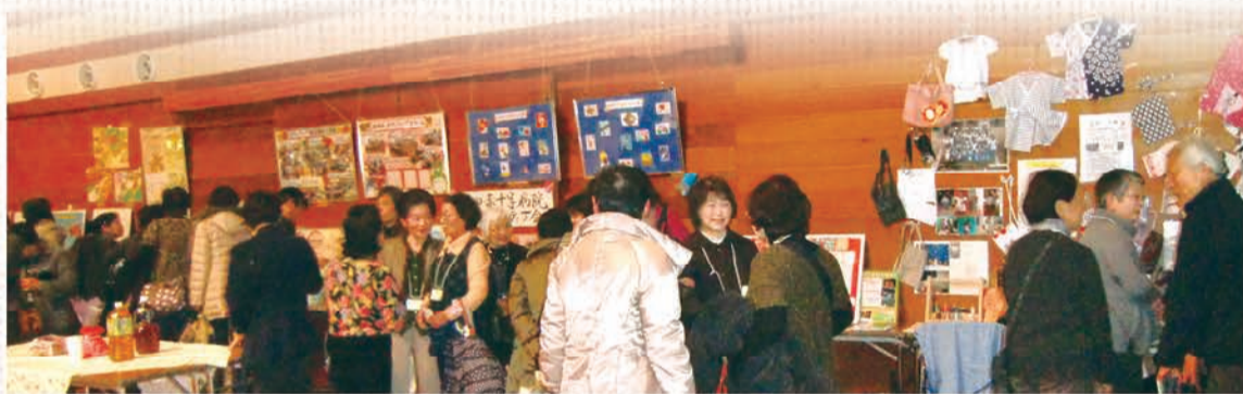
▲懇親会ではお互いの活動を紹介し合ったり、情報を交換したり。人のつながりが増えていきます。

誰にでも何かの形でできるボランティアがある。来年はあなたもボランティアとして、この会場に足を運んでみませんか。