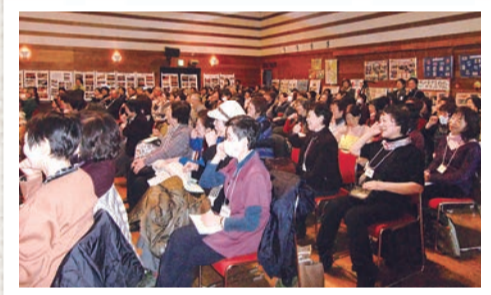
▲集まった180名のボランティア。他のボランティアの活動発表に熱心に見入っています。