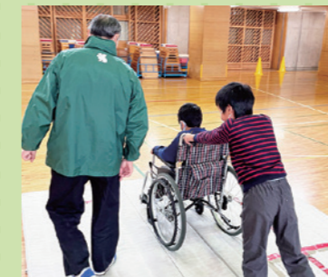
小・中学校での福祉体験学習