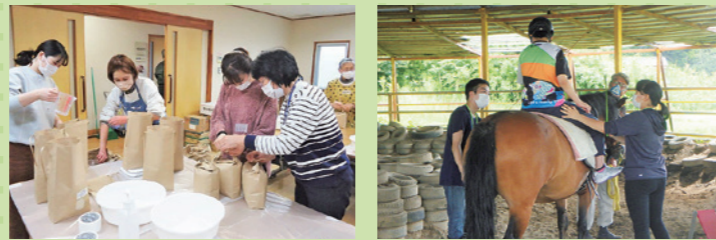
ボランティア活動や養成研修

地域共生社会の実現に向け、支え合いや助け合い活動など、地域の輪が広がる仕組みづくりに取り組むため、関連施策の基本目標として、「住民同士が支え合い、共に築く地域づくり」を目指します。