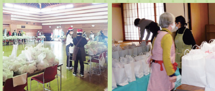
フードパントリーなりた（生活困窮世帯への食品等無料配布会）