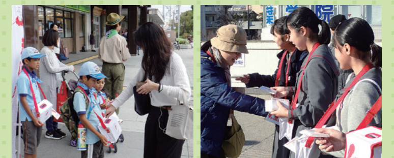
赤い羽根共同募金運動と歳末たすけあい運動