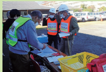
災害ボランティアセンターの訓練や協定締結