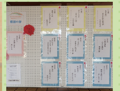
福祉作品コンクール入賞作品の展示