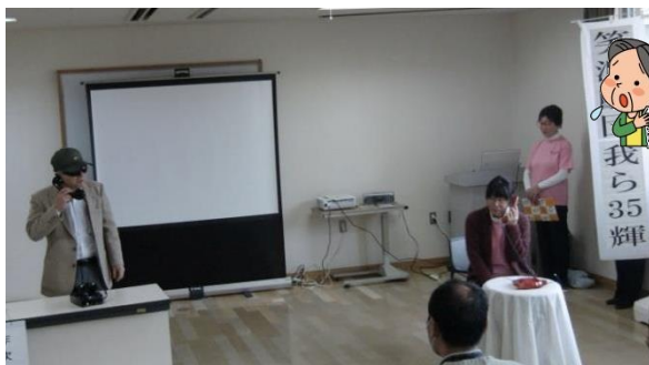
振り込み詐欺市町村別認知状況 (H29.1~12 月)