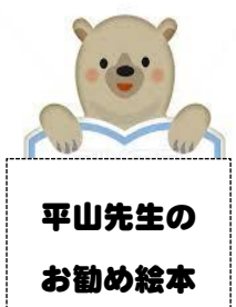
平山先生の お勧め絵本

読み聞かせの仕方として、紙芝居のように芝居をしなくてもいいのです。つい自身の感情を入れて読んでしまいがちですが、「読み、聞かせるもの」と思ってください。ただし、抑揚をつけるのは大切です。