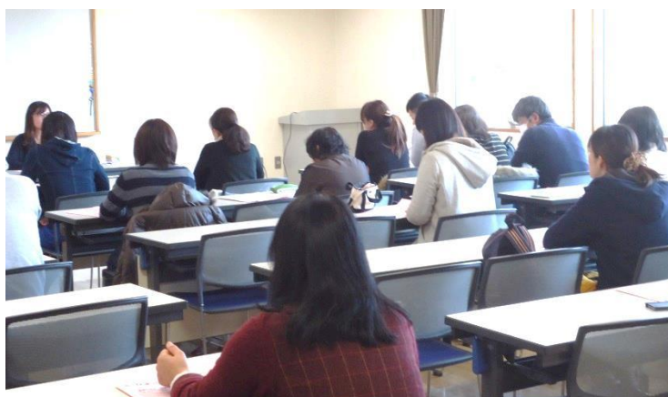
熱心に説明を聞いてくれたお母さんたち。 今、流行りのイクメンパパの姿もありました。

お子さんを初めて人に預けるという体験をされたご家庭もたくさんありましたが、お子さんたちはすぐに慣れて楽しそうにおしゃべりしたり、抱っこされてねんねしたり。その様子にお母さんたちも安心して、参加者全員、入会登録してくれました。ご依頼・ご相談はいつでもお気軽にお電話ください。お待ちしております。(*^_^*)